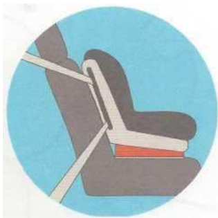
Лицом по ходу движения

Самое безопасное место для установки детского кресла в автомобиле — среднее место на заднем сиденье. Самое небезопасное - переднее пассажирское сиденье. Туда автокресло ставится в крайнем случае, при обязательно отключенной подушке безопасности.