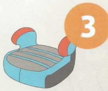
22-36 кг от 6 до 12 лет