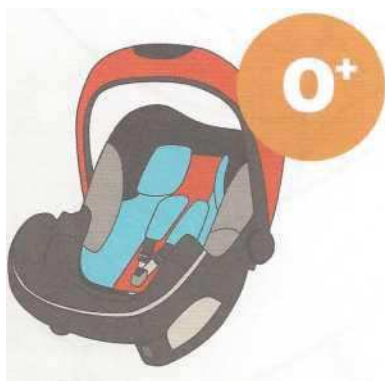
0-13 кг от рождения до 1 года

Покупайте кресло вместе с ребенком. Пусть он попробует посидеть в нем - прямо в магазине.