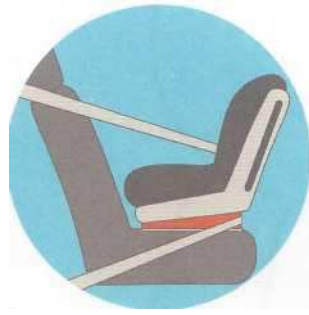
Лицом против движения