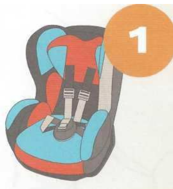
9-18 кг от 9 месяцев до 4 лет