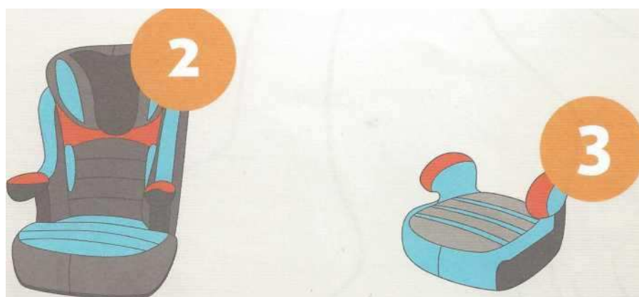
15-25 кг от 3 до 7 лет